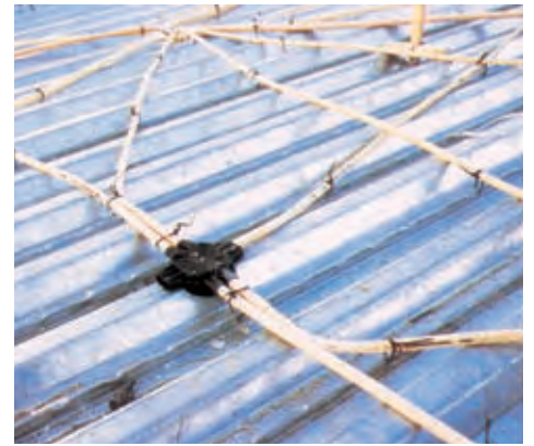
El- och vissa vvsinstallationer kan gjutas in på traditionellt vis. Infällt: Plåtändar tätas med profilskurva tätband, dessa medlev.