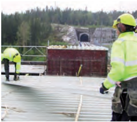
Peva 45 väger bara 7,5 kg/lm och kan oftast monteras utan lyfthjälpmiddel.