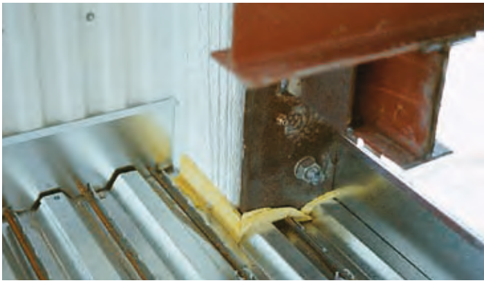
Det är enkelt att på plats utföra goda detaljanslutningar.