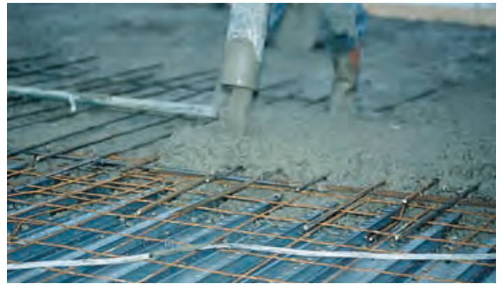
Betongen ska utbredas jämt så att plåten inte får lokala nedböjningar