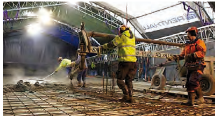
Vid pågjutning av större ytor planeras etappavstängning.