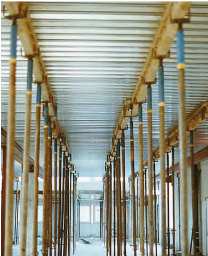
Ett glest lager bockryggar stöttar plåten under gjutfasen.