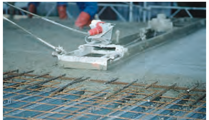
Betongpågjutning görs till färdig yta i ett moment.